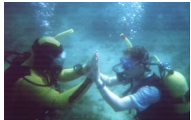
Alle Übungen haben geklappt. Da ist auch Zeit für ein dickes Lob und „Backe, Backe Kuchen!“